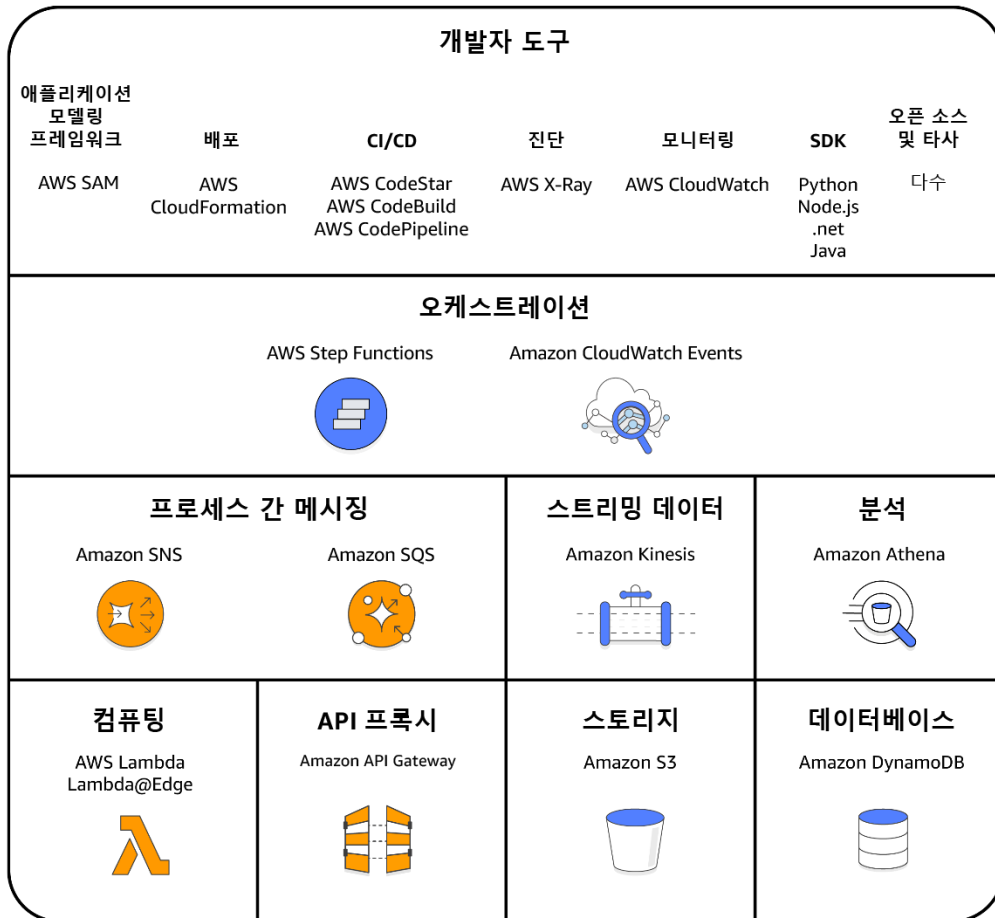
그림 2: AWS 서버리스 플랫폼 구성 요소

2014 년 Lambda 출시 이후 AWS 는 완벽한 서버리스 플랫폼을 제작했습니다. 여기에는 조직이 AWS 서비스 및 타사 서비스와 원활하게 통합할 수 있는 서버리스 앱을 생성할 수 있는 다양한 완전관리형 서비스 모음이 포함되어 있습니다. 그림 는 AWS 서버리스 플랫폼 내 구성 요소의 하위 집합과 그 관계를 보여 줍니다.