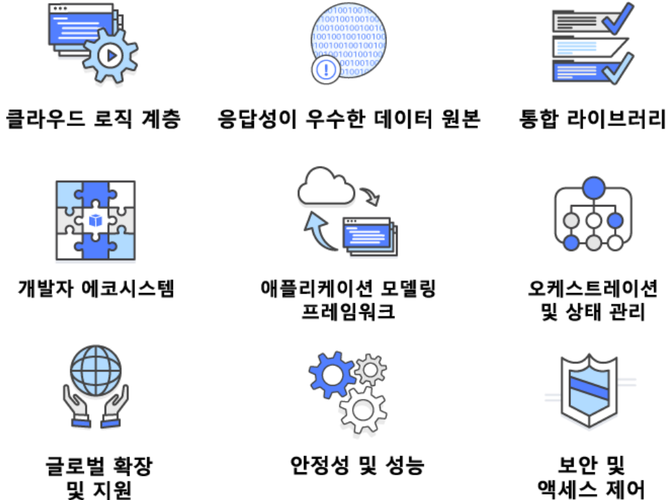
그림 1: 서버리스 플랫폼의 기능

애플리케이션 요소를 확장하고 엔드 투 엔드 안정성을 제공해야 합니다. 기존 앱과 마찬가지로 개발자가 서버리스 솔루션을 성공적으로 생성 및 제공하도록 하는 것이 다차원적인 과제입니다. 다양한 산업에 걸친 대규모 기업의 요구 사항을 충족하려면 서버리스 플랫폼은 다음 기능을 제공해야 합니다.